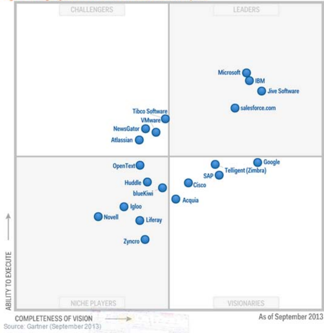
Figure 1. Magic Quadrant for Social Software in the Workplace